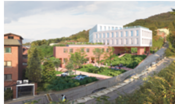
2019년 상반기까지 건립예정인 연희동의 의회 신청사 조경도

은 “무술년(戊戌年) 새해서대문구의회의 연희동시대를 맞아 구민 여러분의 건강과 행복을 기원하며, 7대의회가 이제 얼마 남지 않았지만 열 다섯 명의 의원 모두는 초심을 잃지 않고 구민 여러분의 행복과 서대문구의 발전을 위해 더욱 열심히 의정활동을 수행할 것을 약속드립니다.”고 밝혔다.