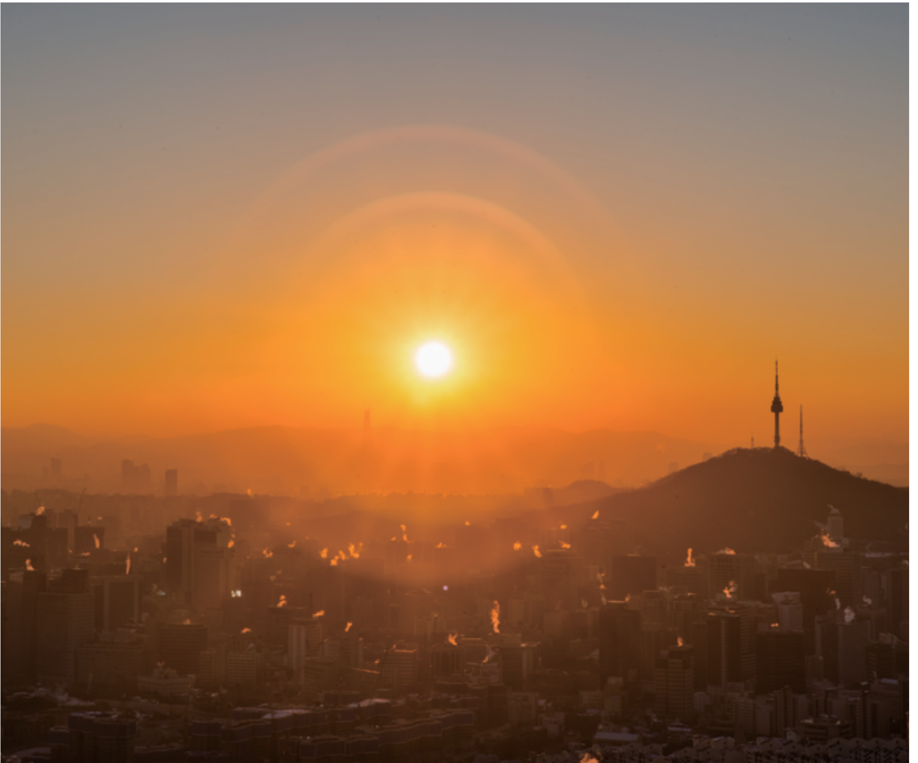
서대문 안산봉수대에서 바라본 일출(제4회 서대문구 블로그 콘텐츠 공모전 수상작)