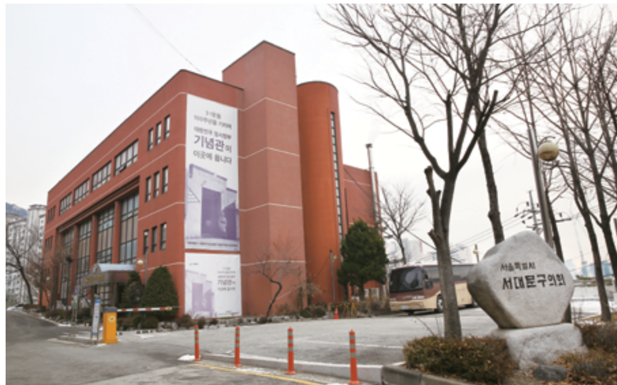
현저동에 위치한 현 서대문구의회청사(1991~2017). 이제는 3·1운동 및 대한민국 임시정부 기념관이 들어설 예정이다.