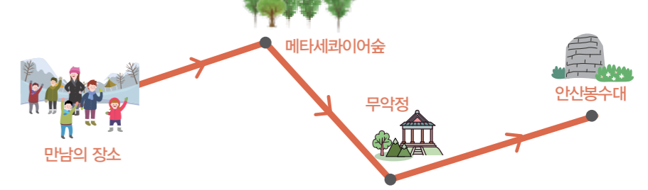
해맞이 자락길 등산로