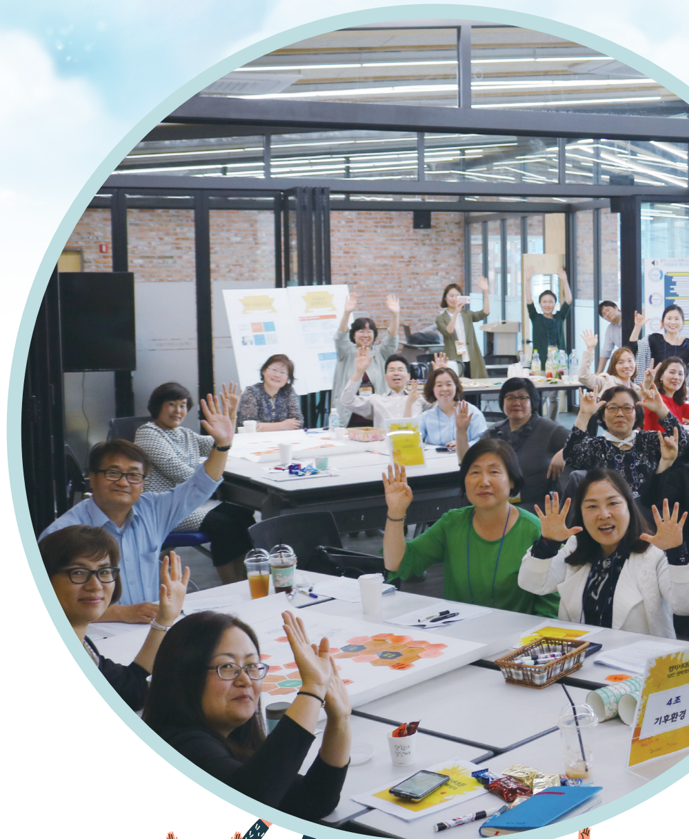
◀ 민관협치스타디움 (수원시 평생학습관)