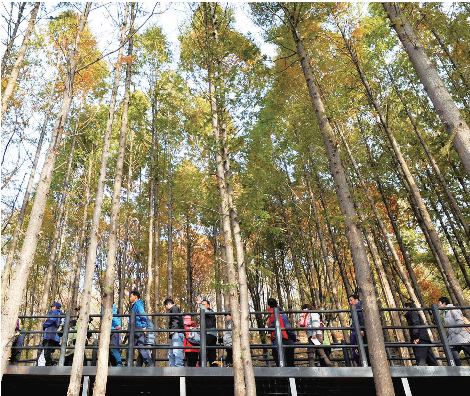
2013년 11월 조성된 안산자락길은 총 연장 7km로, 남녀노소 누구나 이용할 수 있는 순환형 무장애 숲길이다. 키 큰 메타세쿼이아로 둘러싸인 길을 시민들이 걷고 있다.